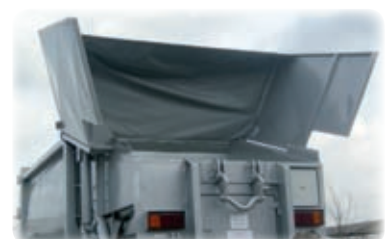
Spannplane als Windschutz