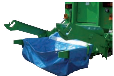
Sack für Handsammlungen