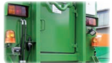
Rückfahrkamera, Rundum- leuchten, Rückleuchten und Arbeitsscheinwerfer