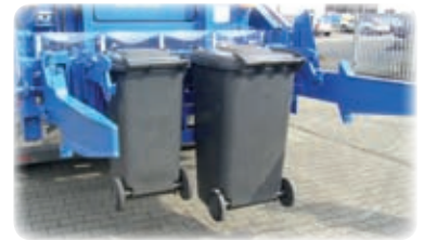
Kamm-Aufnahme für MGB 120/240/360 Liter