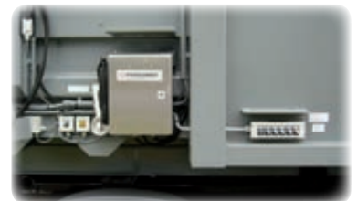
Drucker für Waage und Notbedienung