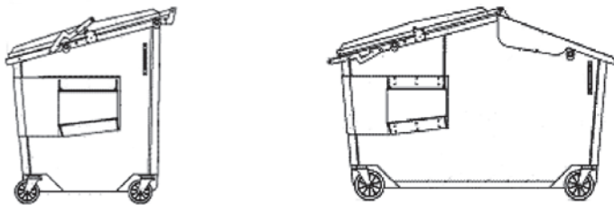
Frontladebehälter nach EN 12574-1, von 2,5 bis 5 cbm (7 cbm bedingt) Breite 1600 / 1710 oder 1820 mm