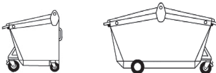
Heckladebehälter nach EN 12574-1, von 2,5 bis 5 cbm (7 cbm bedingt) ehemals und noch gültige DIN 30737